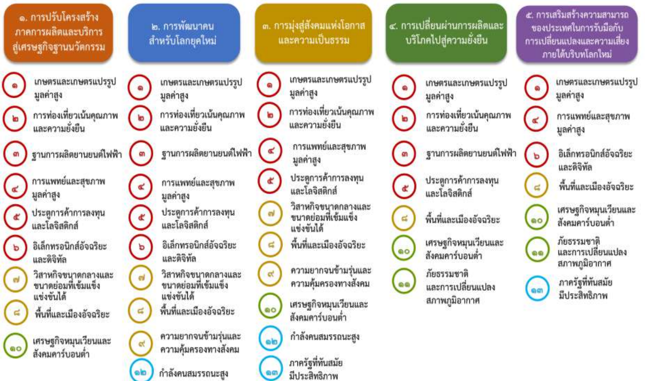
แผนภาพที่ ๓.๑ ความเชื่อมโยงระหว่างหมวดหมู่การพัฒนาที่เป้าหมายหลัก

ความเชื่อมโยงระหว่างหมวดหมู่การพัฒนาที่เป้าหมายหลักแสดงไว้ในแผนภาพที่ 3.1 โดยหมวดหมู่การพัฒนาที่กำหนดขึ้นเป็นประเด็นที่มีลักษณะเชิงบูรณาการที่ครอบคลุมการพัฒนาตั้งแต่ในระดับต้นน้ำจนถึงปลายน้ำ และสามารถนำไปสู่ผลพัฒนาทั้งในมิติเศรษฐกิจ สังคม ทรัพยากรธรรมชาติและสิ่งแวดล้อมไปพร้อมๆ กัน ทำให้หมวดหมู่แต่ละประการสามารถสนับสนุนเป้าหมายหลักได้มากกว่าหนึ่งข้อ นอกจากนี้การพัฒนาภายใต้แต่ละหมวดหมู่ไม่ได้แยกขาดจากกัน แต่มีการสนับสนุนหรือเอื้อประโยชน์ซึ่งกันและกัน