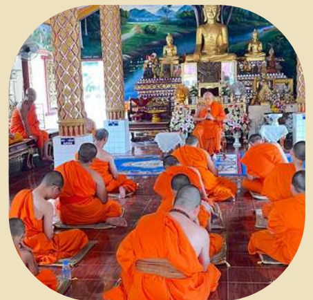
วันเสาร์ ที่ 1 เมษายน พ.ศ.2566 พิธีปลงผม การให้โอวาท ในการปฏิบัติตน เพื่อเตรียมความพร้อม ในการเข้าสู่ร่มกาสาวพัสตร์ ณ ลานต้นโพธิ์ วัดศรีปิงชัย(ทุ่งป่าแก)